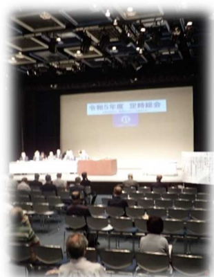
兵庫県阪神北県民局長 宮口 美範